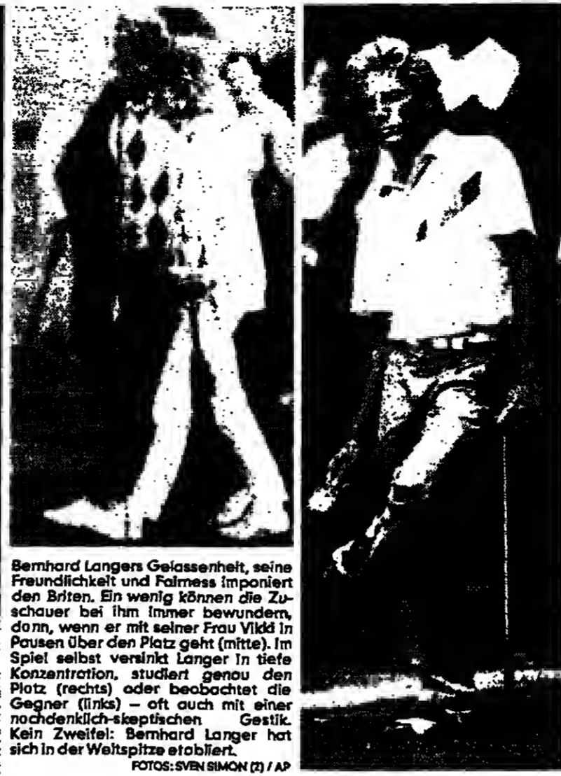
Bernhard Langers Gelassenheit, seine Freundlichkeit und Fairness imponiert den Briten. Ein wenig können die Zuschauer bei ihm immer bewundern...